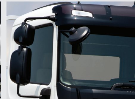
Gương chiếu hậu và tấm che nắng phía ngoài có đèn ở hai đầu