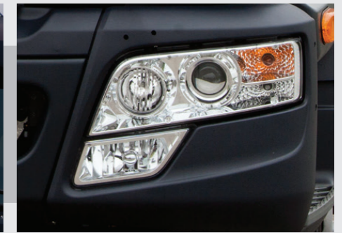
Đèn chiếu phản xạ đa chiều