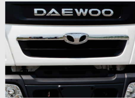
Lưới tản nhiệt & cánh 2 bên