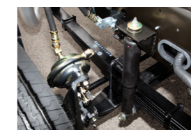
Phanh hơi trước Hệ thống giảm chấn