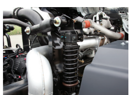
Hệ thống treo cabin

Lưu ý: Hình ảnh mang tính tham khảo, có nhiều options cho khách hàng lựa chọn