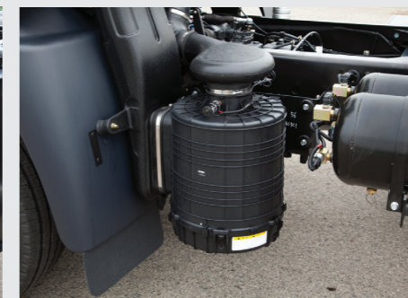
Lọc gió lắp ở hông xe