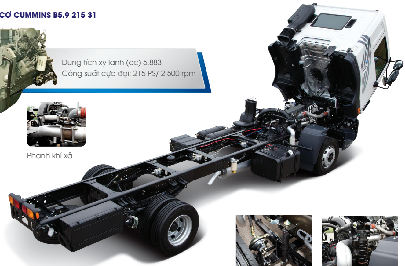
Lốp xe đồng bộ Cỡ lốp: 10.00 - 20