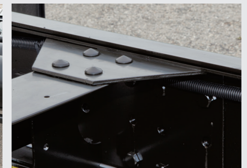
Chassis 2 lớp