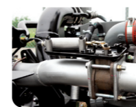
Phanh khí xả

Dung tích xy lanh (cc) 5.883 Công suất cực đại: 215 PS/ 2.500 rpm