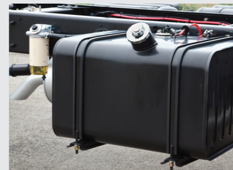
Thùng nhiên liệu và bộ lọc dầu