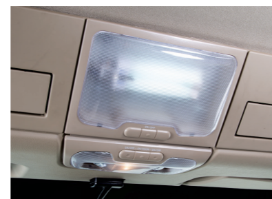
Đèn trần cabin