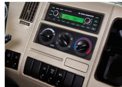
Bảng điều khiển âm thanh, hệ thống điều hòa,...