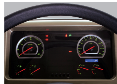
Bảng đồng hồ táp lô