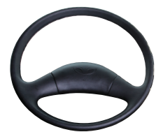
Vô lăng lái

Kích thước lớn, có tích hợp nút nhấn còi