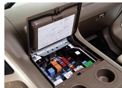
Hộp cầu chì